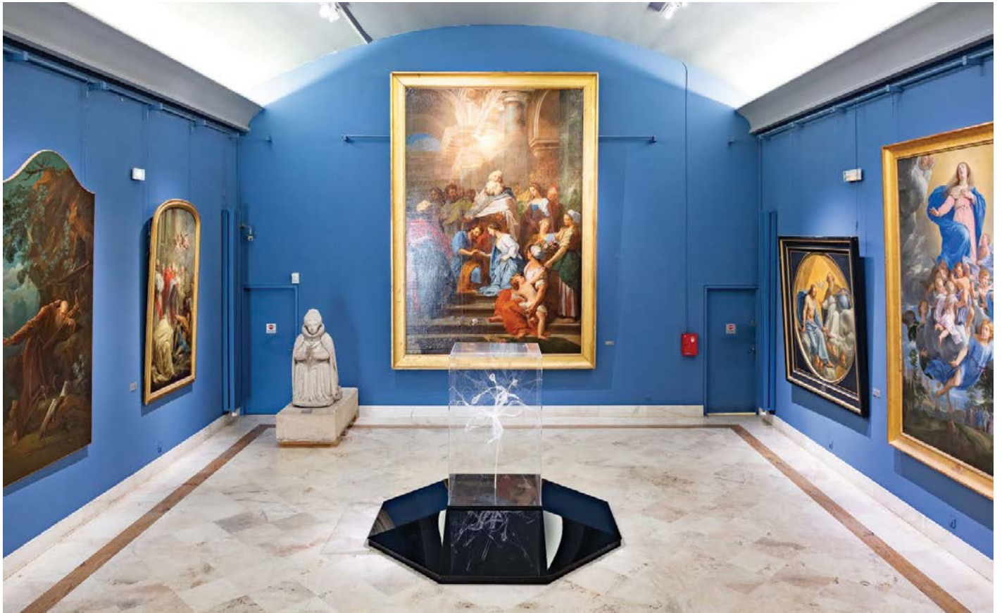
Salle Grands formats. Vue générale