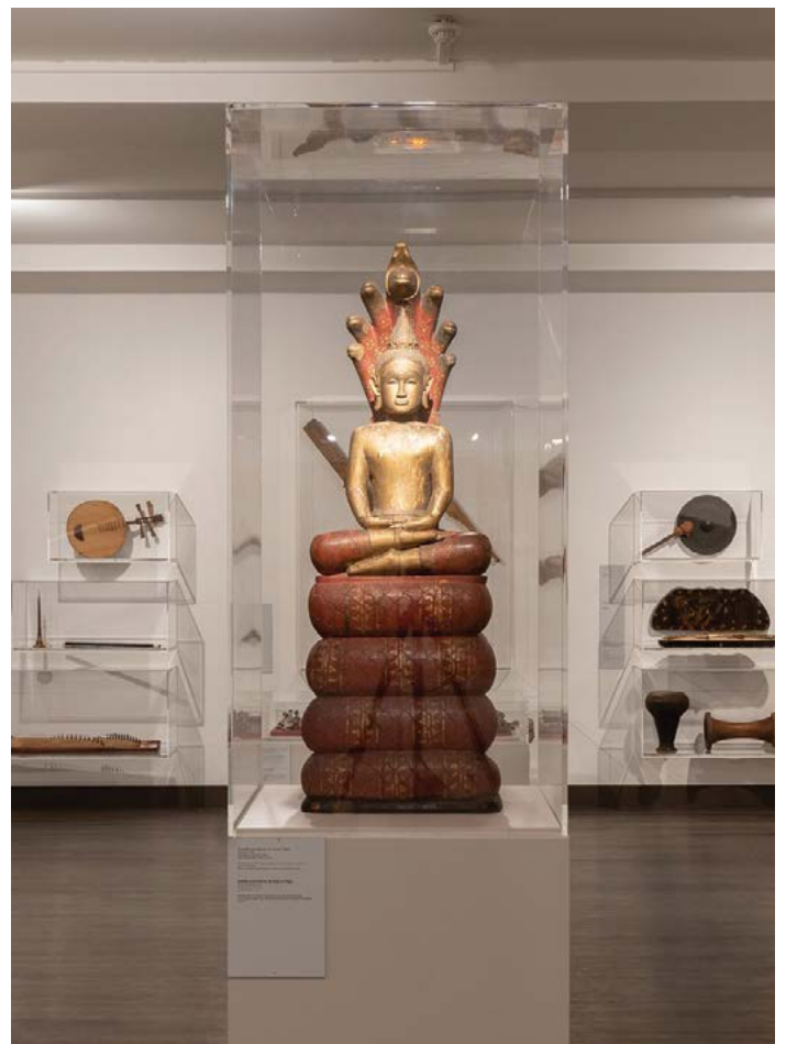
Salle Cambodge avec Bouddha Devanagari