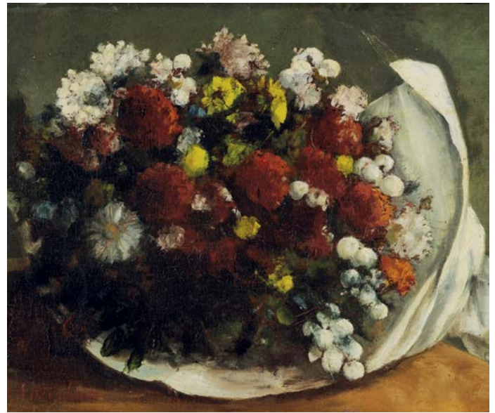
Gustave Courbet (1819-1877) Bouquet, 1871. Huile sur bois, 22 x 29 cm Musée des Beaux-arts et de la Dentelle, Alençon (inv. 899.1.6)