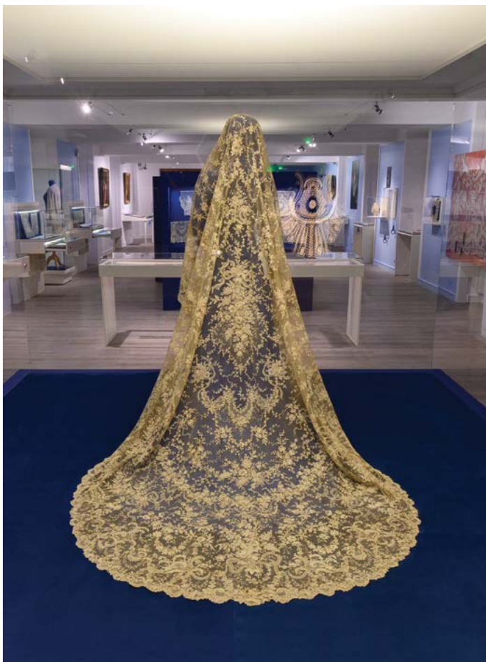
Salle Dentelle avec le voile de mariée