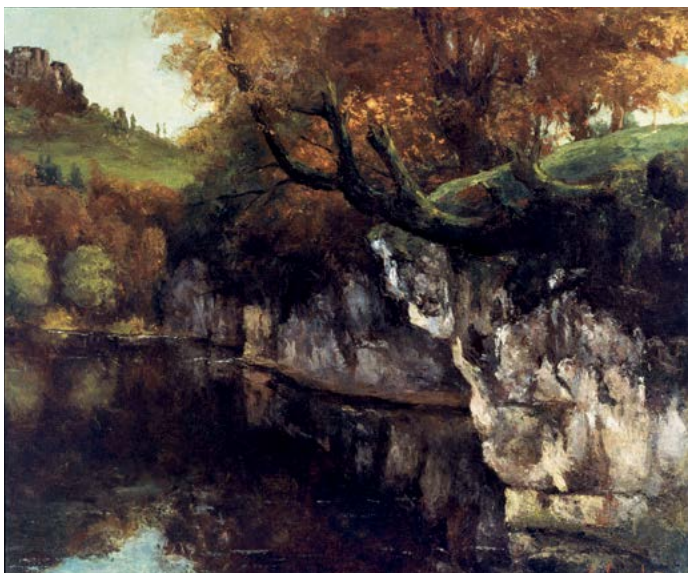
Gustave Courbet (1819-1877)

La Loue à Scey-en-Varais. Vers 1860. Huile sur toile, 68 x 80 cm Institut Gustave Courbet, Ornans