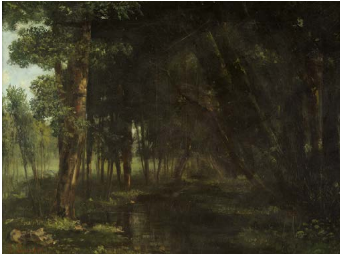
Gustave Courbet (1819-1877) Sous-bois, vers 1856. Huile sur toile, 48,5 x 65 cm Musée des Beaux-arts et de la Dentelle, Alençon (inv. 870.1.1)

Un premier tableau de Gustave Courbet, une huile sur toile signée mais non datée représentant un paysage de sous-bois traversé par un ruisseau auprès duquel un chevreuil s'abreuve, est acquis en 1869 pour le musée de peintures auprès d'un marchand par la Ville d'Alençon pour la somme de 600 francs (ce qui représentait alors 60 % du budget annuel du musée).